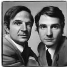
François Truffaut et Jean-Pierre Léaud