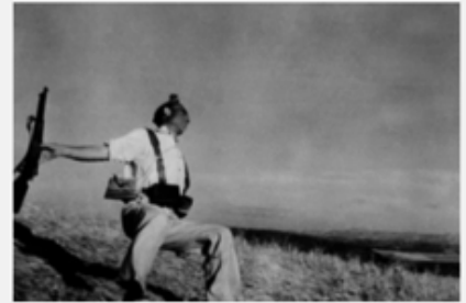
Exhibition 36 from 100 © Robert Capa, 1936

Avec cette image de la guerre civile espagnole, le correspondant de guerre Robert Capa devient mondialement connu. La photo a été prise le 5 septembre 1936.