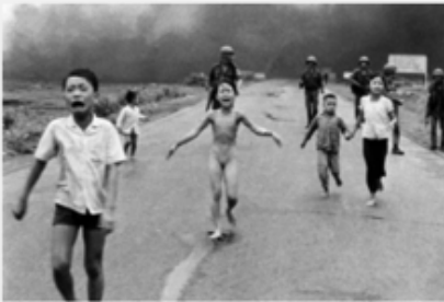
Exhibition 36 from 100

Quelques photos montrent les horreurs de la guerre de manière brutale comme cette photo emblématique réalisée par le photographe vietnamien Nick Ut. Cette photographie a été prise le 8 Juin 1972.