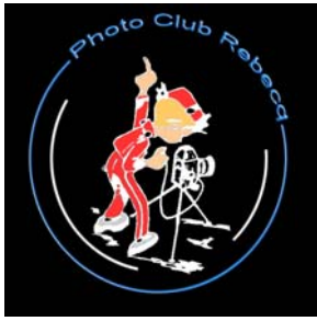
Photo Club Rebecq ASBL