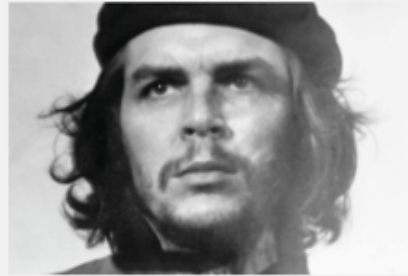
Exhibition 36 from 100 © Alberto Korda, 1960

Peut-être l'image la plus célèbre de ces 100 ans: Alberto Korda photographie le Che Guevara avec son Leica M2 pendant un service commémoratif en 1960.