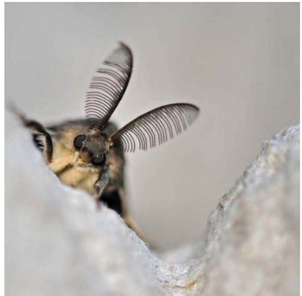
4 ème place : Evelyne