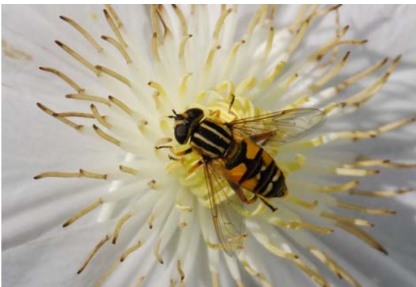
5 ème place : Xavier