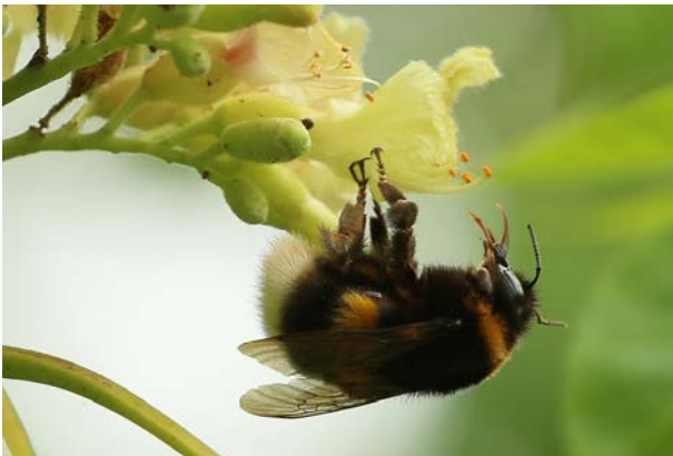
3 ème place : Axelle