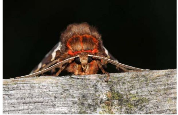
2 ème place : Evelyne