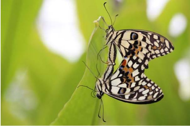
1 er place : Axelle