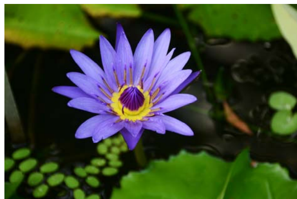
8 ème place : Charly