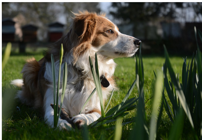
7 ème place: Charly