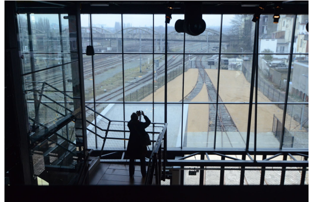
L'inconnue du bout du quai

Que vous partiez à la recherche du soleil ou d'aventures, ou bien que vous choisissiez de profiter de notre belle région et de ses environs, je vous souhaite d'excellentes vacances et revenez-nous bien en forme pour la rentrée et notre gala qui promet un excellent millésime.