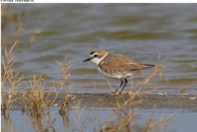
Gravelot à collier interrompu

Affut au poste de nourrissage, au bain, au nichoir Affut flottant