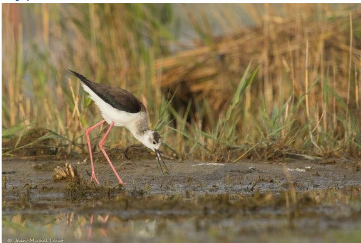
Echasse blanche capturant un alevin