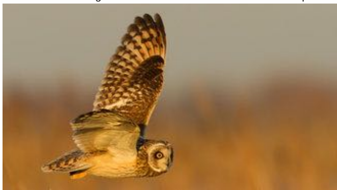
Hibou des marais (Cliquer sur l'image pour agrandir)

Le stage se déroule pour partie au Marais de Laviers et sur différents sites adaptés à la photo d'oiseaux. Nous louons un marais privé en plus pour la mise en situation. L'hébergement en hutte est inclus dans le tarif ainsi que les repas.