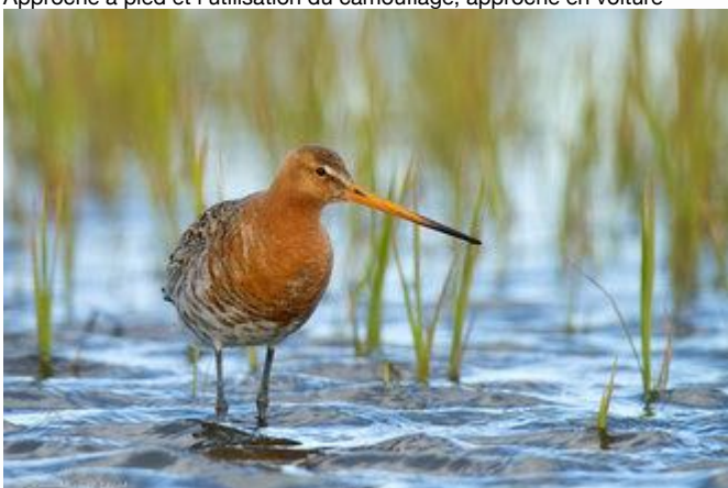
Barge à queue noire

Approche à pied et l'utilisation du camouflage, approche en voiture