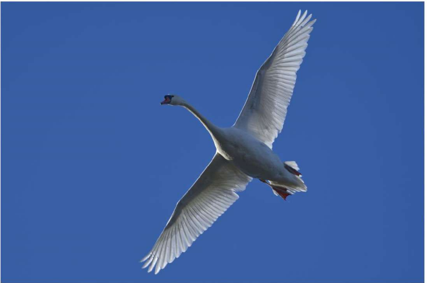
Bonhomme Henri - Cygne en vol - RPCEN Nivelles