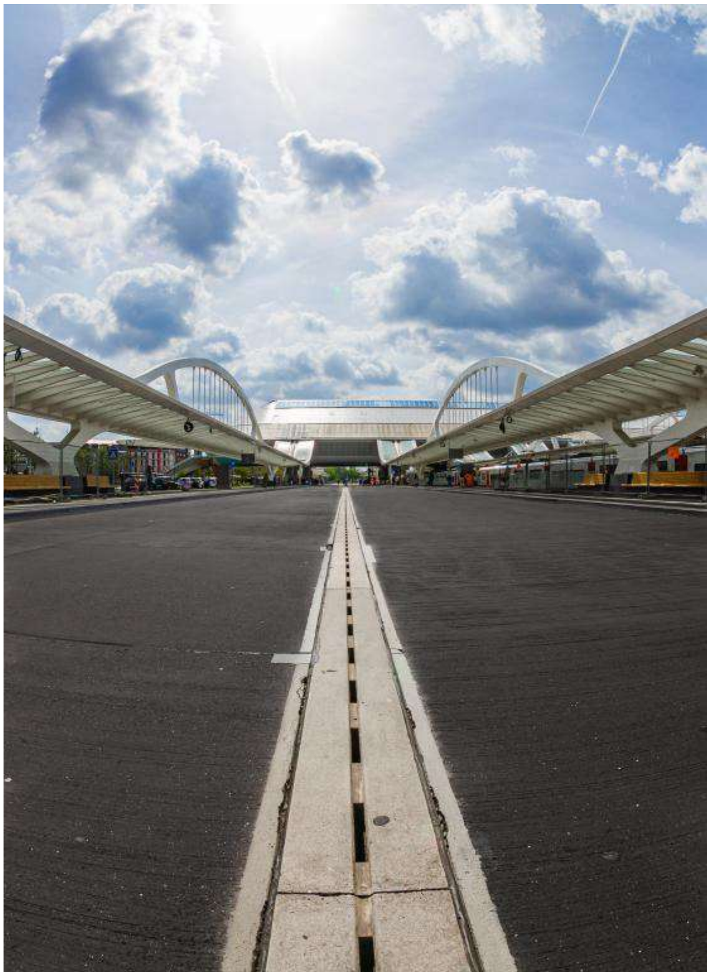
La ligné gare de Mons - Derèse Jean-Claude - RPCEN Nivelles