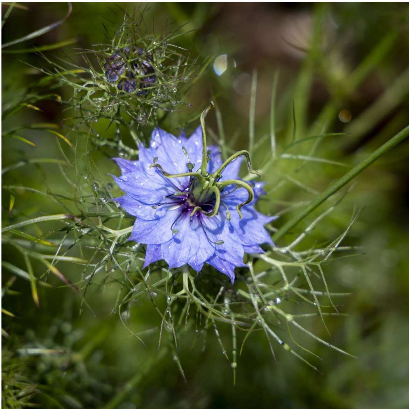
Brigitte CAUCHIES - Après la pluie - Espace Image Création

Nous publions une ou deux photos par auteur, tirée du jeu en cours,.