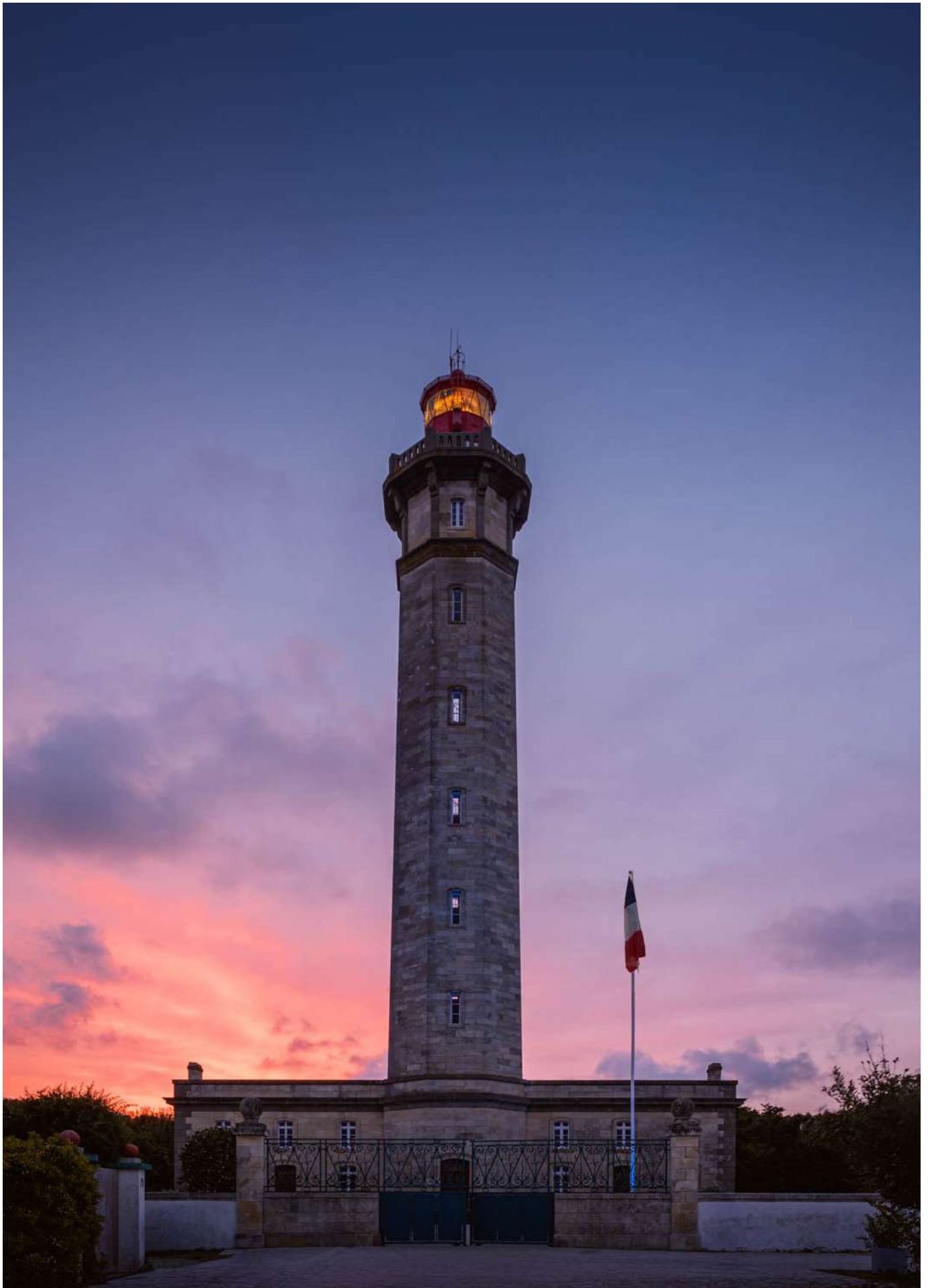
Vilain Nathalie - Phare des baleines - Espace Image Créatio