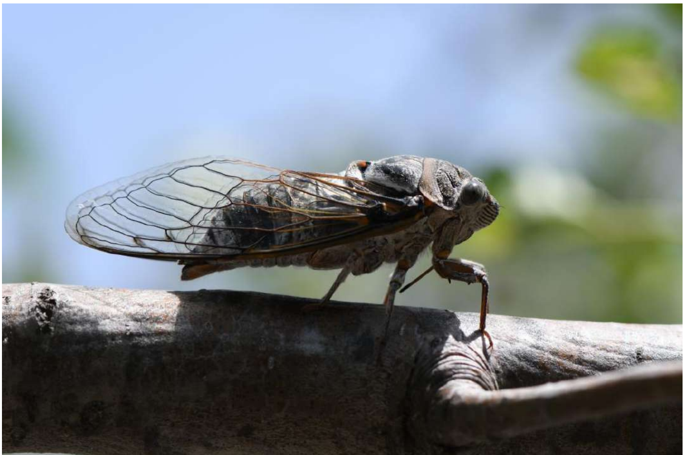
Bonhomme Henri - Cigale - RPCEN Nivelles