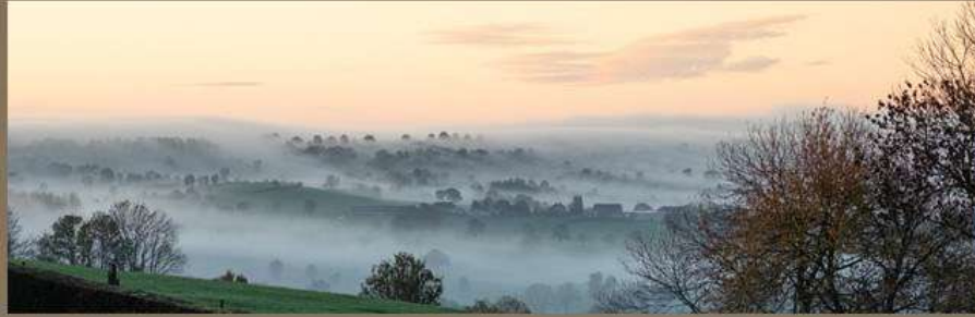
1er prix 2023 - Antoine HEYERES : Brume sur les bocages