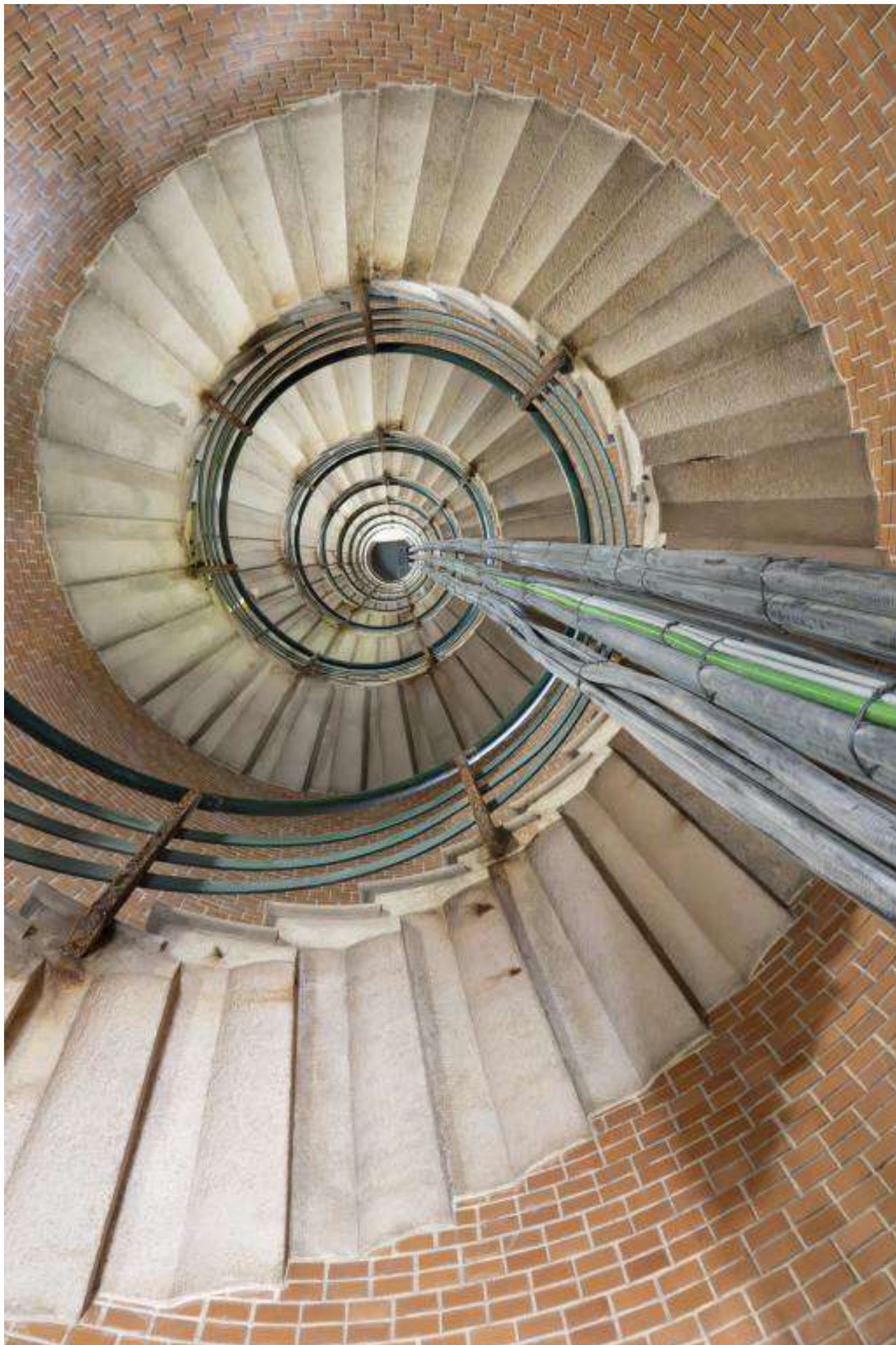
Francis Roth - Touquet Paris plage - RPCEN Nivelles